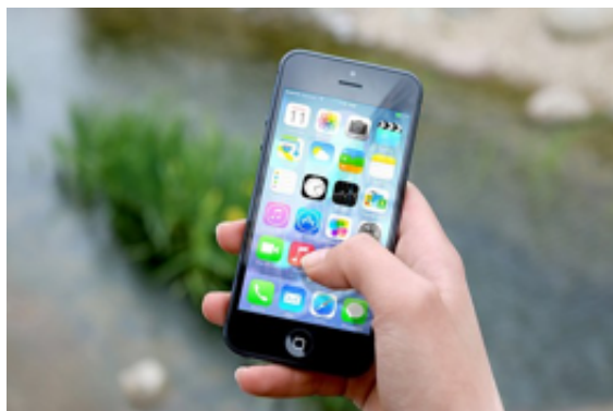
MedAppCare : certification d'applications et de sites web en Santé

explosion de l'offre, le consommateur utilisateur n'est pas en capacité de pouvoir vérifier le sérieux de tous ces produits. D'autant plus que ces outils demandent très souvent des données personnelles voir médicales pour utiliser leur service.